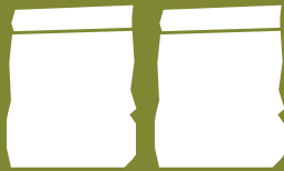
10 kg (500 qm)